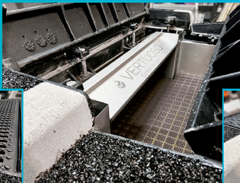
TGAS position fermée standard