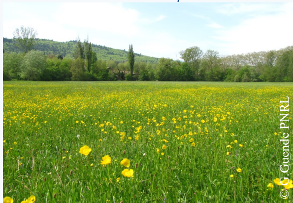
Les prairies de l'Encreme