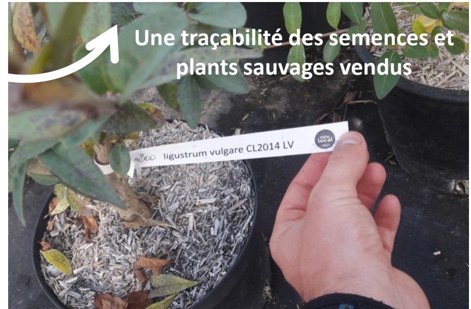
Une traçabilité des semences et plants sauvages vendus