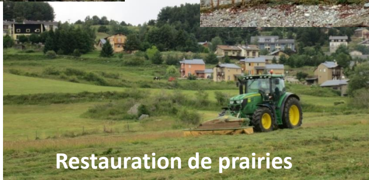
Restauration de prairies