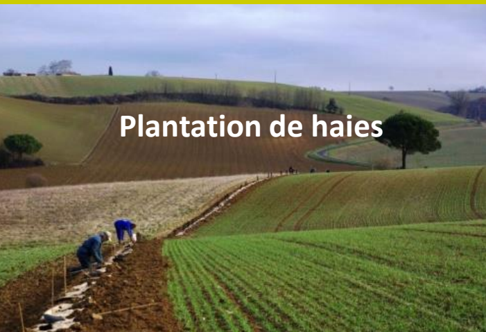
Plantation de haies