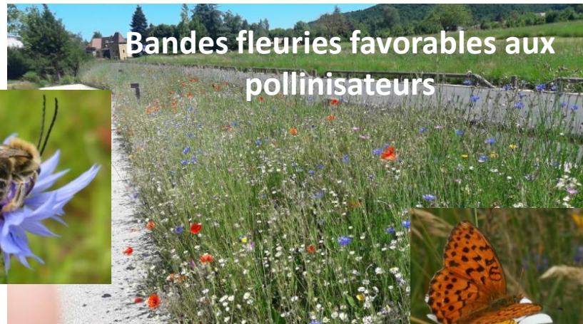
Bandes fleuries favorables aux pollinisateurs