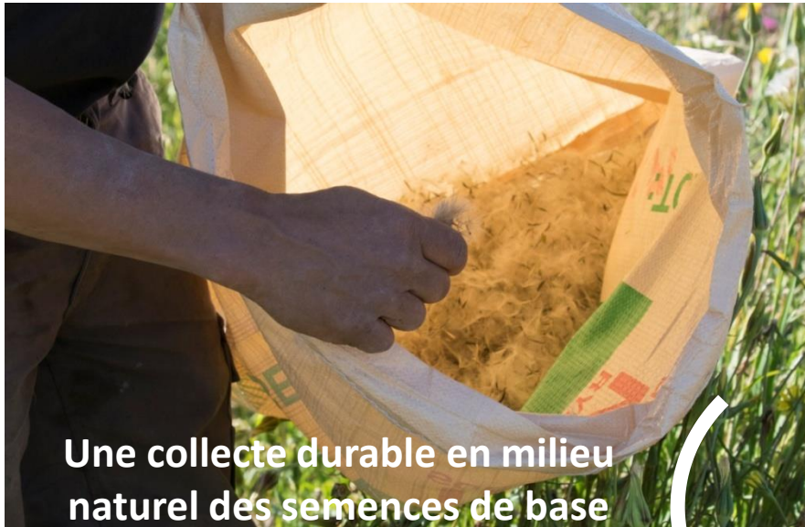
Une collecte durable en milieu naturel des semences de base