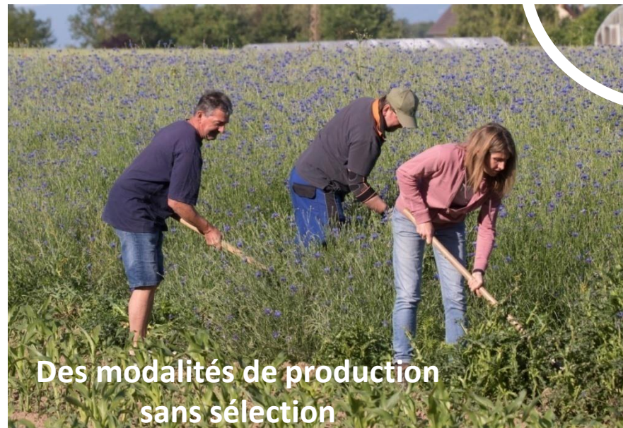
Des modalités de production sans sélection