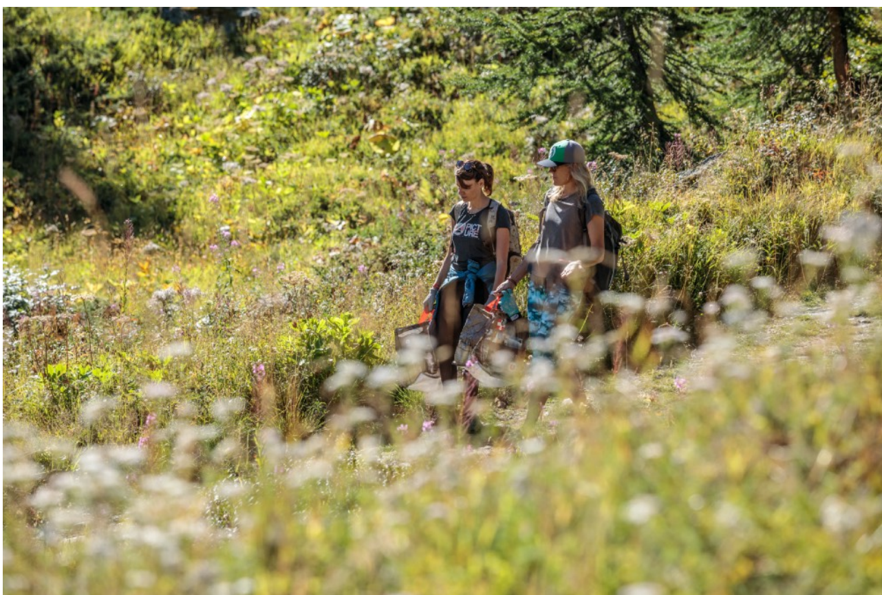
Stop Waste Tour / Les Arcs

L'événement à l'initiative de l'UCPA des Orres est co-organisé avec l'Office du Tourisme et les Remontées Mécaniques de la destination. La matinée a été dédiée aux jeunes de l'UCPA, qui ont récolté les déchets en fonction de leur activité : les VTTistes ont enfourché leur VTT pour récolter le maximum de déchets alors que les « multi-activités » parcouraient quant à eux les pentes à pieds. Avant le repas du midi l'ensemble des jeunes se sont réunis autour de la bâche de caractérisation pour peser, vider leur sac et identifier les déchets récoltés. Cette caractérisation visuelle et laissée durant le début d'après midi a permis de sensibiliser et de mobiliser d'autres volontaires présents sur la destination.