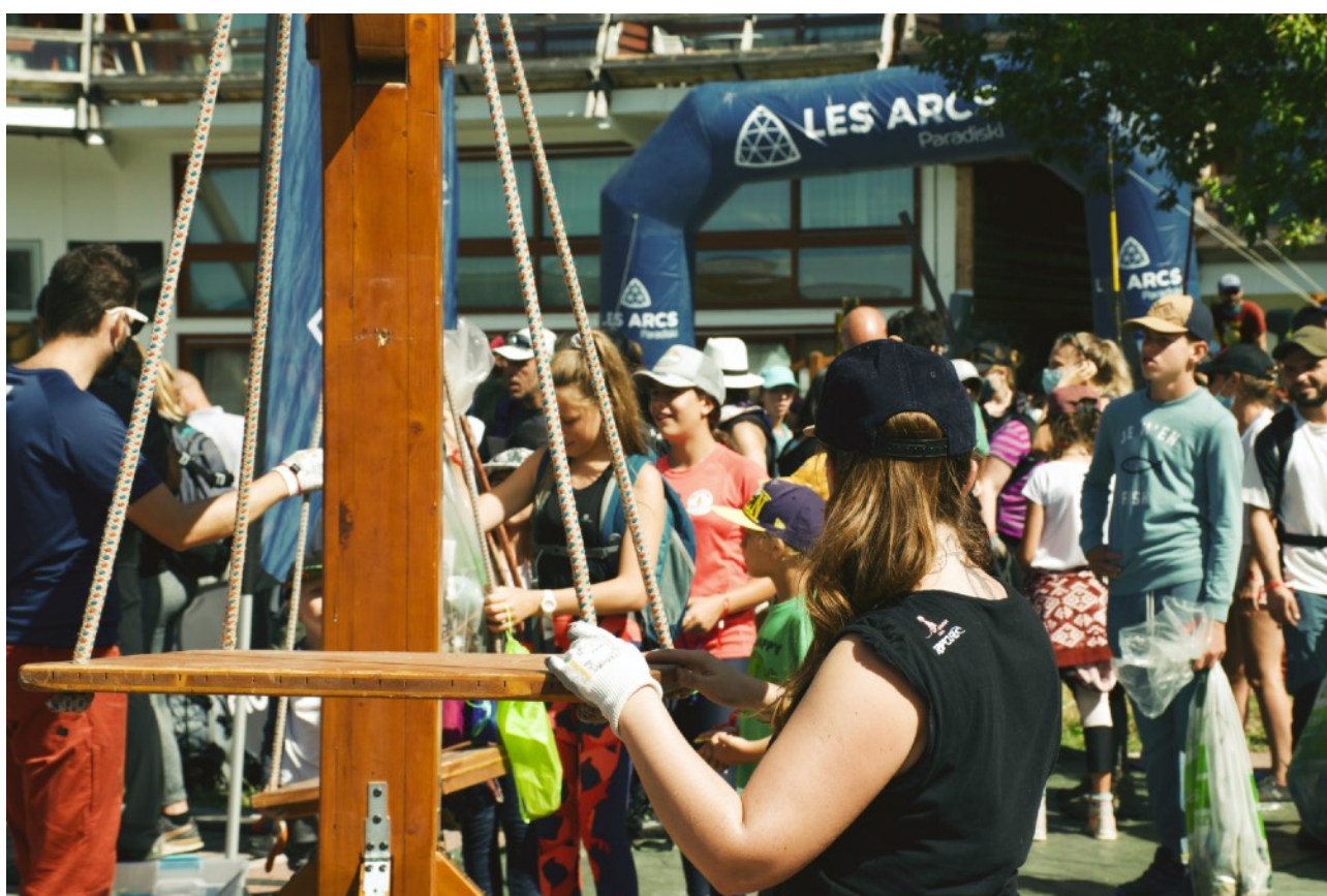
Stop Waste Tour 2020 - Les Arcs

Mountain Riders a accompagné 27 opérations dont 23 se sont concrétisées malgré le contexte sanitaires et 4 ont été annulées. L'association Mountain Riders s'est mobilisée sur 12 ramassages pour sensibiliser et caractériser les déchets dont 3 événements d'ampleur : Val d'Isère, les Arcs et Valberg ayant réunis au total 650 volontaires.