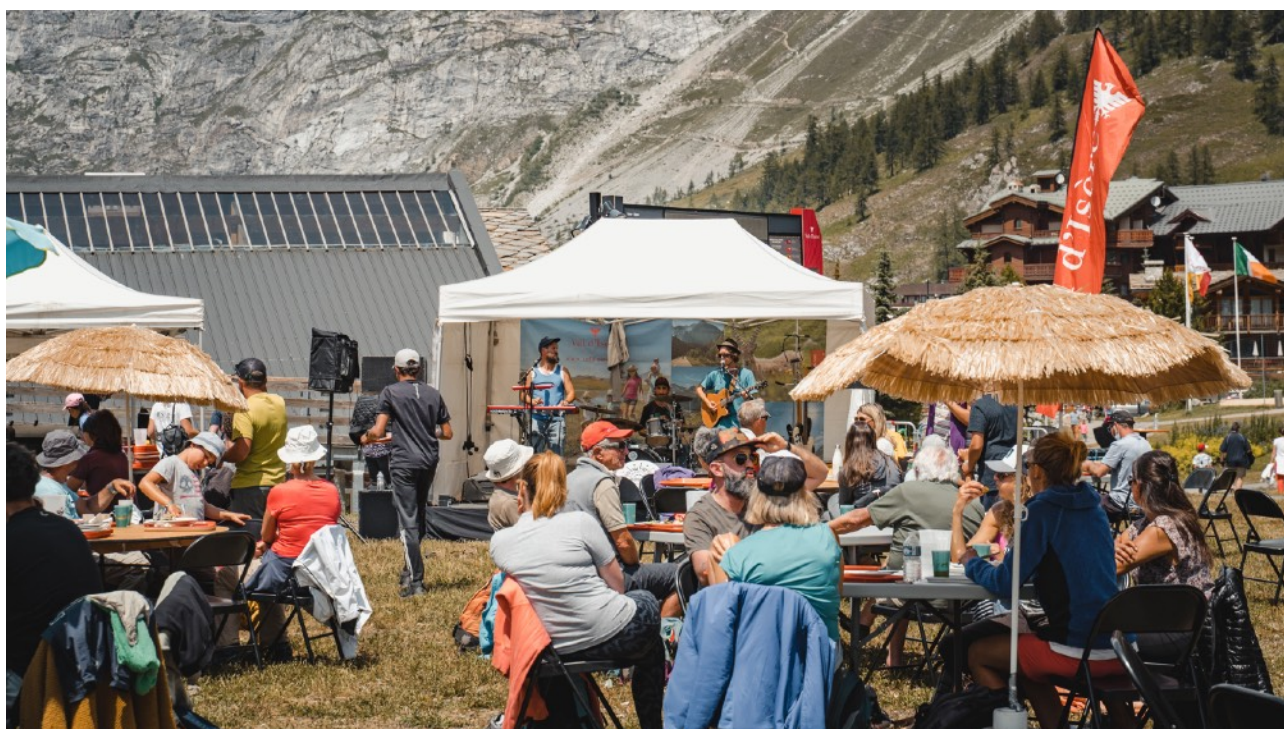
Journée de l'Environnement à Val d'Isère

VALBERG - LES ORRES - LES ARCS - VAL D'ISÈRE