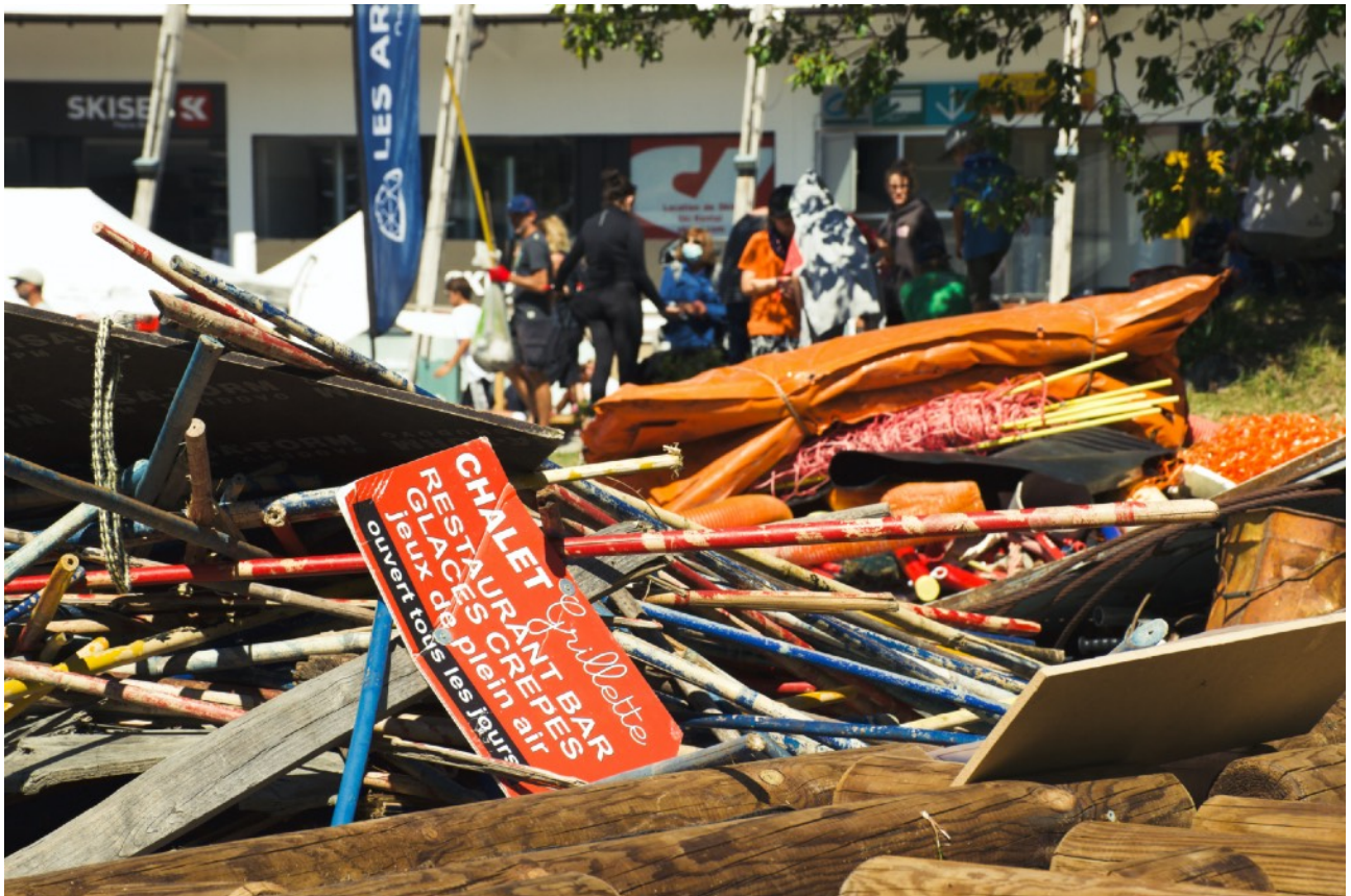
Jalons de piste ramassés lors du Stop Waste Tour 2020 (Les Arcs)

Au sein des déchets lié à la consommation, c'est encore le mégot qui se retrouve en tête. Les mégots sont retrouvés aux abords des restaurants d'altitude ou le long des remontées mécaniques. Ce déchet dont le volume est faible pollue 500 L d'eau ; les polluants qui le constituent se retrouvent régulièrement dans l'alimentation car ils suivent le cycle de l'eau.