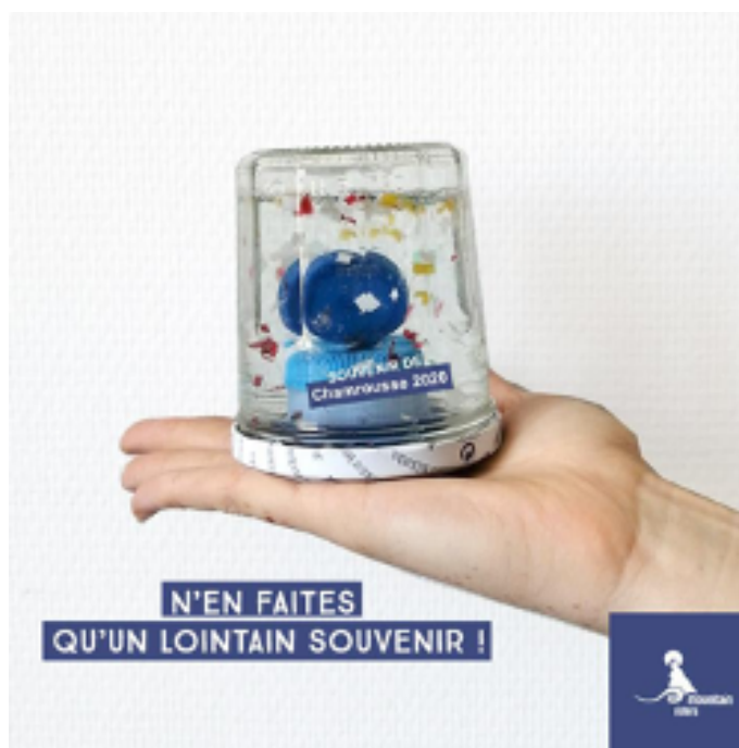
Outils de sensibilisation (à gauche, panneau en bois - à droite, boule à neige) déployés pour la campagne 2020

Toujours dans cette optique de sensibiliser de manière ludique et sans moraliser, nous avons imaginé et conçu 70 boules à neige à partir de déchets récoltés en montagne .