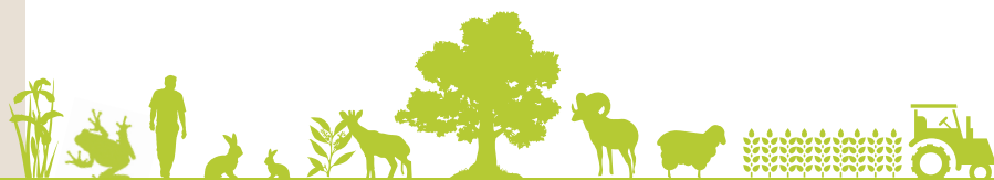
Catégories liées au niveau de fragmentation des éléments anthropiques - SCOT de la CASA