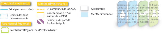
Figure 7 : Détermination de l'aire d'étude

Cartographie réalisée par Philippe ECARD (DAECT/PE, 2012) avec les données fournies par la DAECT/SIG. Elle constitue un document de travail, elle ne doit pas faire l'objet de distribution ou de reproduction. Les couches de données sont en Lambert 93 au 1/280000ème.