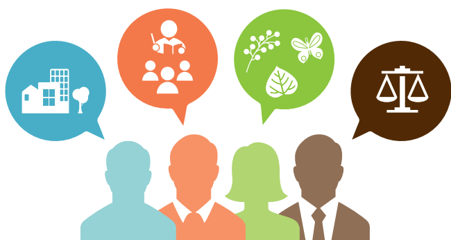
Le choix d'une équipe pluridisciplinaire