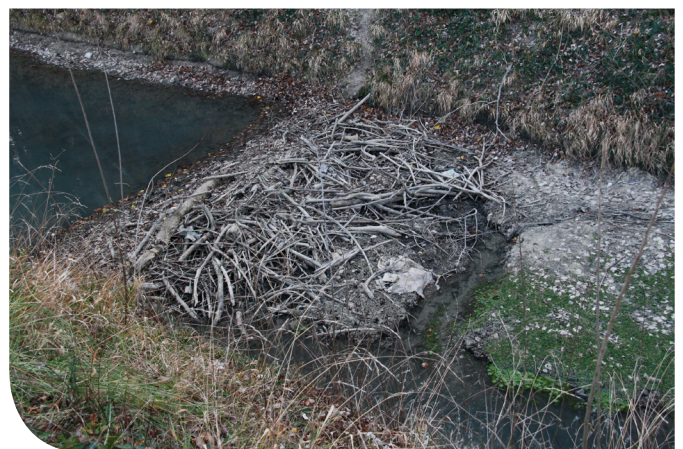
Barrage de castor sur un contre-canal du Rhône, Bouches-du-Rhône.